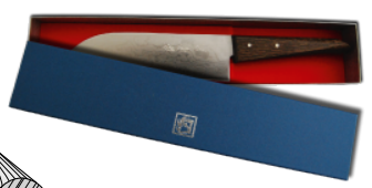
紙箱入 グリップカラー：ダークブラウン