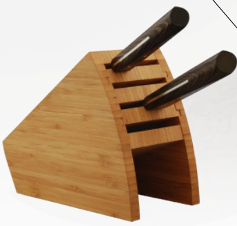
ナイフスタンド収納イメージ 手打ち鍛造

人間工学に基づいたグリップ形状(3Dグリップ)を新開発。あらゆる角度で持ちやすく、作業し易い形。水に強い積層強化木を使用。