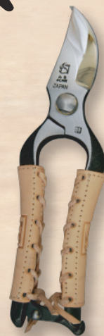
TS090 B型バネ内蔵剪定鋏 8インチ