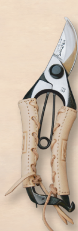
TS096 A型剪定鋏 7インチ