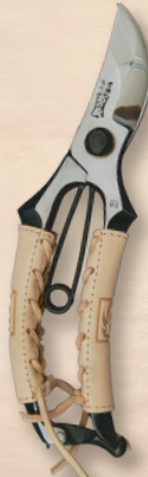
TS061 F型改良剪定鋏 8インチ