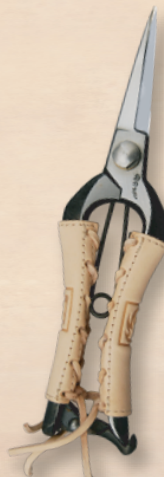
TS062 双刃型両刃芽切鋏 8インチ