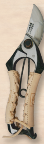
TS060 A型改良剪定鋏 8インチ